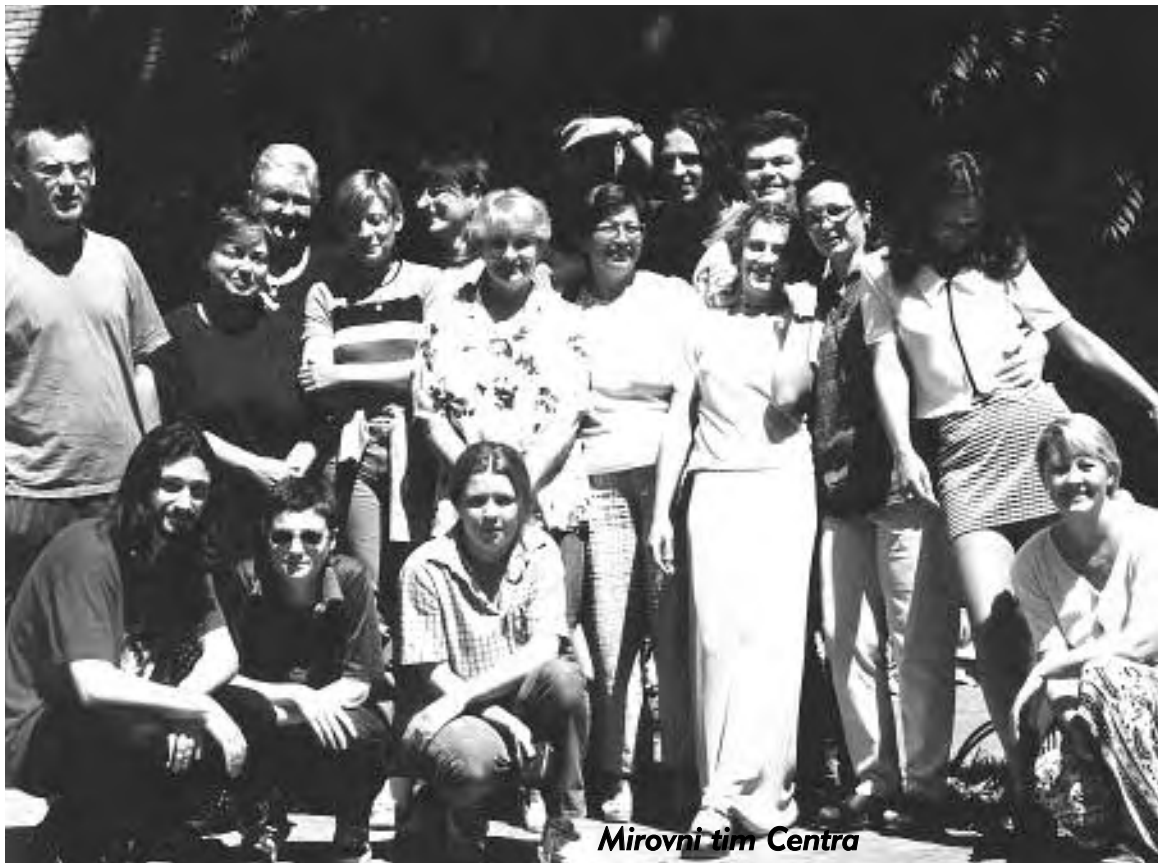
Mirovni tim Centra

Iako sve lokalne zajednice u poslijeratnom periodu imaju vrlo slične probleme, svaka od njih ima i mnogo svojih specifičnih problema, ali i različitosti s obzirom na interese i motiviranost samih mještana. Iz tih objektivnih, ali i subjektivnih razloga s kojima su se mirovni timovi morali suočiti, svaki je tim ostvario značajna postignuća, ali u različitim aktivnostima.