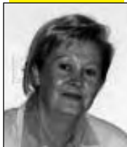
Piše: Vesna Lierman

Naročito se angažirao katolički župnik iz Tenje, koji je osnovao grupu mještana iz svoje župe, zatim pravoslavni svećenik iz OŠ Tenje koji je okupio grupu osnovnoškolske djece, te pred-