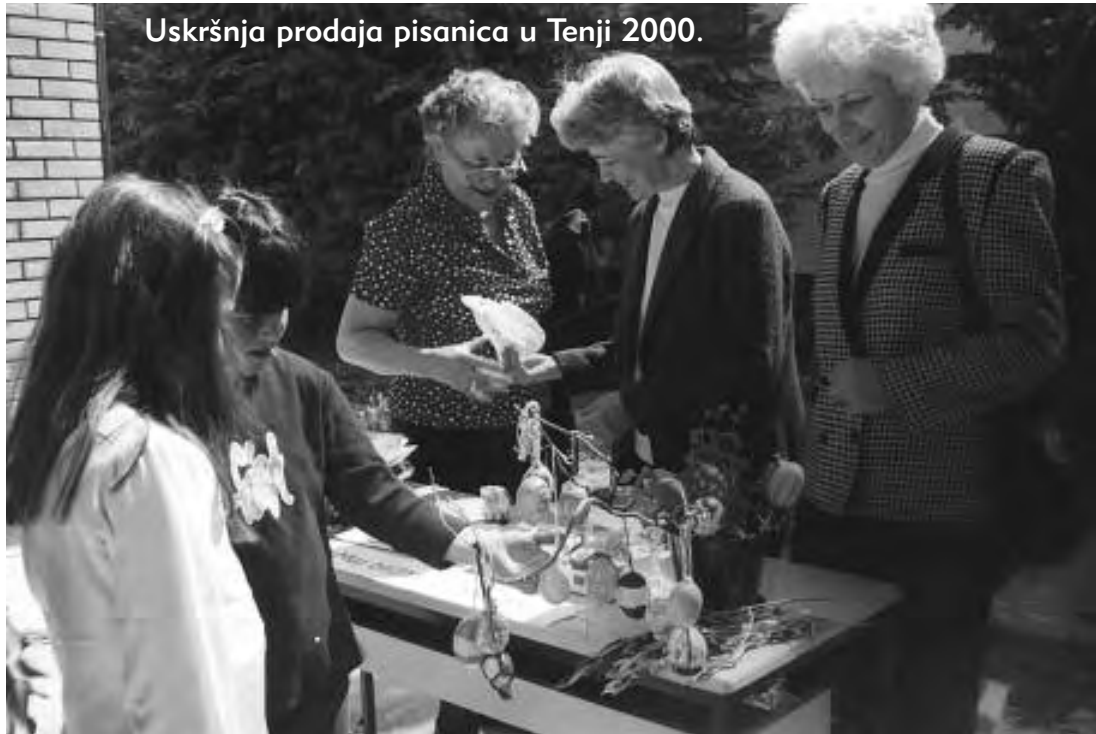
Uskršnja prodaja pisanica u Tenji 2000.

padnost. Dozvolili su nam rad u školi i vide veliki napredak u odnosima među djecom. Nedavno smo svi zajedno bili na izletu... Neke su se nastavnice uključile u obrazovanje za mirovni odgoj.