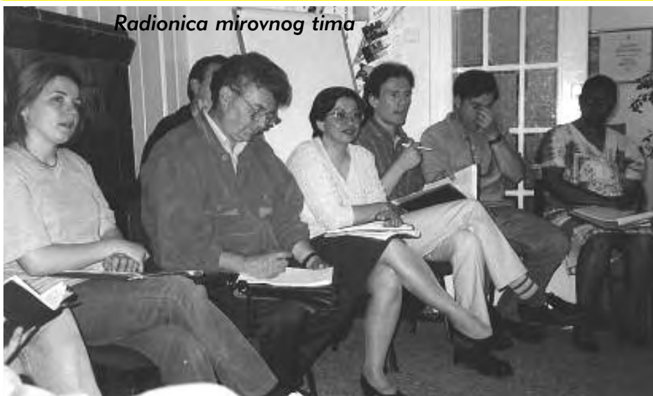
Radionica mirovnog tima

10. Changing Capacities of Citizens, James Rosenau, Background papre for the Commission on Global Governance, 1993.