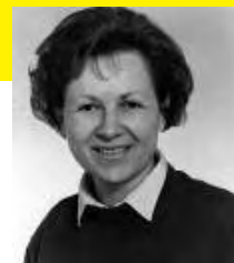
Autorica teksta: JELENA MARAS

Žene su nositeljice i davateljice života. Ta uloga davateljice života čini nas zaštitnicama života i miroljubivijima u načinu na koji djelujemo u krugu naših obitelji i prema javnosti. Želim naglasiti da je većina žena više od muškaraca okrenuta prema miru jer je to u balansu sa "ženskom logikom" i ženskim vrijednostima