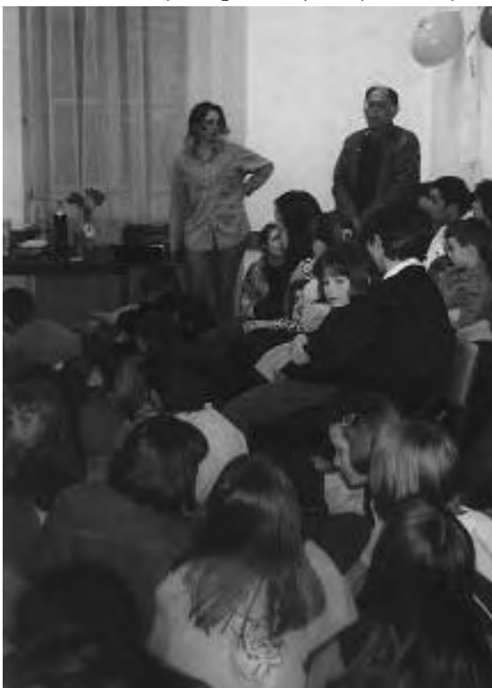
Dodjela diploma učenicima informatičkog tečaja

U situacijama koje su preteške za izravnu diskusiju ili mogu potaknuti sukob, ljudi ipak imaju želju biti zajed-