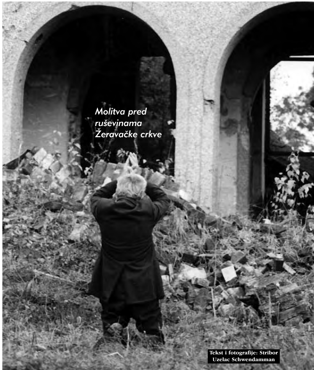
Molitva pred ruševinama Žeravačke crkve

tatora i već iskusnih slušača iz Okučana, Berka, Tenje i Belog Manastira krenuti će na posao timski i sa u detalje razrađenim akcijskim planom, u kojem su definirani ciljevi, rokovi, lokaci je, sredstva, ljudi, moguće prepreke, potpora, logistika itd. Već su uspostavljeni kontakti sa mještanima u Gornjim Kolibama i sa zavičajnim klubovima izbjeglica iz Žeravca i Koliba Donjih, te sa srpskim vlastima u Bosanskom Brodu i uredima UNHCR u Doboju i CIMIC u Derventi. Mirovni tim iz Slavenskog Broda raditi će na slušanju u bosanskoj Posavini od lipnja do rujna ove godine. Potom će uslijediti sumiranje i vrednovanje postignutih rezultata.