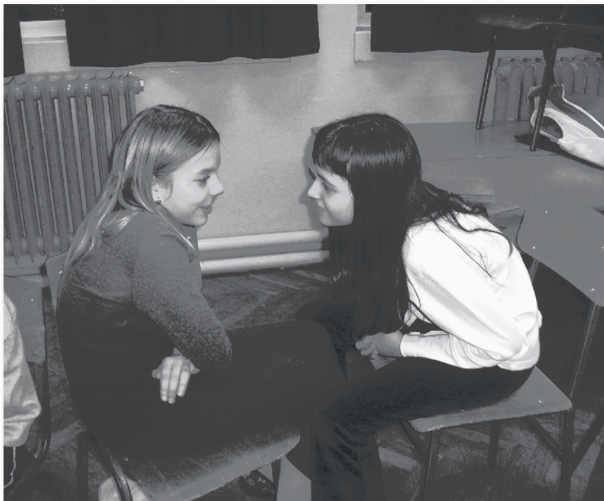
Vježbamo slušanje, 4. razred O.Š. "Vijenac"

Treba reći da je moguće ostvariti trajan klub medijatora u jednoj školi, ako netko od učitelja dobije medijaciju u zaduženje kao izvannastavnu aktivnost, i ako su Učiteljsko vijeće i ravnatelj/ica senzibilizirani za ovu metodu rješavanja sukoba i podržavaju je. Osim toga, važna je i potpora Ministarstva znanosti i obrazovanja u smislu inicijative da komunikacijske vještine i medijacija budu obvezni programi na svim fakultetima koji obrazuju buduće učitelje i nastavnike, koji će onda s lakoćom to raditi u školama, na svojim radnim "amjestima". To bi bila potpora kvalitetnijoj komunikaciji i kreativnom rješavanju sukoba u učeničkim i nastavničkim kolektivima i, postupno, u cijelom društvu. ■