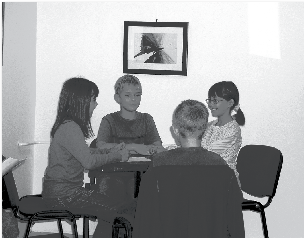
Povodom Međunarodnog dana mira: medijatori Kluba medijatora O.Š. "Jagode Truhelke" prikazuju proces medijacije, Osijek 2006.

Što to jest - biti medijator? Otku- da mi želja istraživati medijaciju kao proces rješavanja sukoba? Kako to- me učiti druge, posebice djecu? Bila su to pitanja i izazovi koje sam postavljala sebi i svojim kolegicama kad smo se u Centru za mir, nenasilje i ljudska prava Osijek počeli baviti idejom treninga učenika za vršnjačku medijaciju, a i kasnije (pa i danas) kada provodimo treninge za volontere, kontakt - policajce, suce, odvjetnike, učitelje.