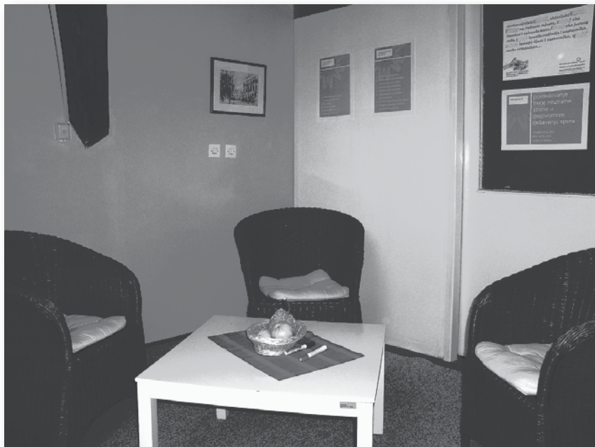
Prostor za medijaciju. Medijacijski centar Osijek.

Važno nam je bilo da kontakt policajci i suci saznaju što je medijacija, koje su njezine prednosti, koji nedostaci, da zajedno razmislimo o tome koji su slučajevi pogodni za medijaciju, da upoznaju medijatore i time razviju povjerenje u ljude kojima bi mogli upućivati stranke na medijaciju. Postavljanje procedura bio je dio treninga.