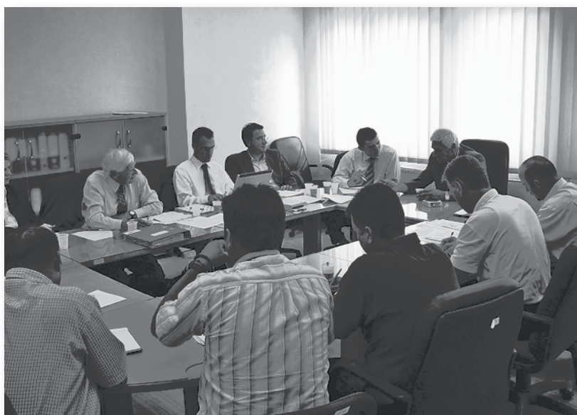
Predstavnici općina Rahovec i Orahovac na medijaciji o međuetničkim sukobima u zajednici

Integrativna medijacija je sustavna metoda rješavanja sukoba na lokalnoj razini kroz integrativne procese koji kreću od građana prema institucijama lokalne vlasti. Zamisljena je tako da odgovornost za provedbu mirovnih procesa ostaje u rukama lokalnih vođa, osiguravajući medijaciju kao vjerodostojnu alternativu nametnutim rješenjima. Osnažuje i uključuje ljude u inicijative za rješavanja sukoba, čime pridonosi održivosti tih inicijativa. Okupljajući dionike na različite načine u integrativni proces, otvara prostor za nadilaženje prepreka postizanju konsenzusa i pomaže lokalnim vođama u njihovim nastojanjima da razviju demokratske strukture u područjima opterećenim sukobima. Integrativna medijacija se temelji na ideji da vanjska perspektiva, koja podržava lokalne inicijative i usredotočuje se na potrebe sukobljenih strana, osnažuje samoinicijativnost, kreativno mišljenje i rješavanje problema.