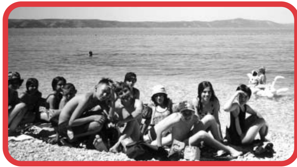
Mali novoseljani u Živogošću 2001. godine.

Dapače, odnosi su bili dobri, ljudski. Možda su upravo zato i povrede dublje - osjećaju se prevarenima. Bivši vojnici nisu pokazali želju za razgovorom o detaljima ratnoga iskustva, nego su tek naveli činjenicu kako su rat dočekali u uniformi.