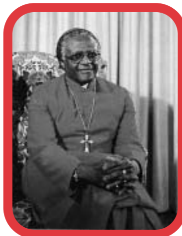
Nadbiskup Desmond Tutu

Potpuni izvještaj o radu Komisije možete pronaći na web-adresama: http://www.polity.org.za/govdocs/commissions/1998/trc/index.htm http://www.truth.org.za