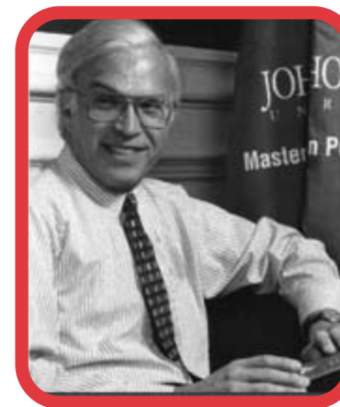
Dr. Lester M. Salamon

Odgovor vjerojatno leži u četiri krize i dvije revolucije kroz koje je umanjena uloga države te otvoren put za ovakav porast u organiziranim volonterskim akcijama. Prvi od ovih poticaja je kriza moderne države blagostanja. Tijekom posljednjeg desetljeća sustav državne zaštite za starije i slučaj gospodarskih neprilika koji je na razvijenom Zapadu poprimio svoj oblik do 50-ih godina, nije se više činio djelotvornim. Smanjeni globalni gospodarski razvoj tijekom 70-ih godina doprinio je vjerovanju kako su troškovi socijalne skrbi, koji su znatno porasli tijekom prijašnjih desetljeća, istisnuli privatna ulaganja. Stvoreno je uvjerenje kako preopterećena i birokratizirana