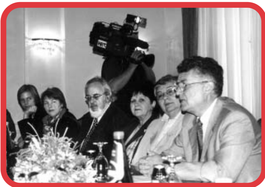
Gosti iz Švicarske na primanju kod župana Osječko-baranjske županije dr. Ladislava Bognara.

Posjeta je završila svečanim primanjem kod župana Osječko-baranjske županije, dr. Ladislava Bognara. Župan je u razgovoru s gostima i donatorima istaknuo važnost i vrijednost njihove pomoći u edukaciji učitelja što je urodilo kvalitetnijim radom s djecom prognanicima, povratnicima, traumatiziranim djecom i njihovim roditeljima, te drugim stradalnicima rata i braniteljima. Bila je to i prilika za njih da postave pitanja o sadašnjoj političkoj i gospodarskoj situaciji u regiji. Kako je ovo bio njihov prvi susret s predstavnicima vlasti tijekom višegodišnje suradnje s Centrom za mir-Osijek, gosti su susret ocijenili iznimno važnim i poticajnim za nastavak suradnje.