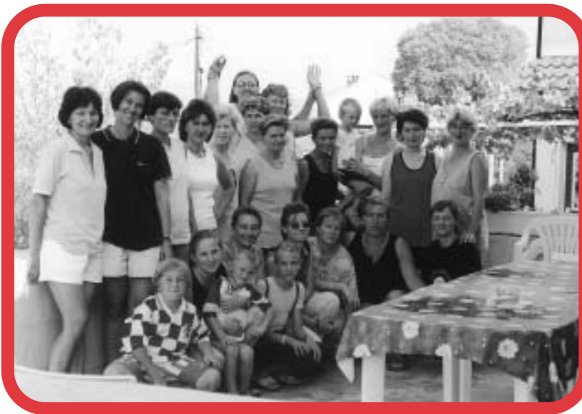
Fotografija za uspomenu na zajedničko ljetovanje u kući "Seka".