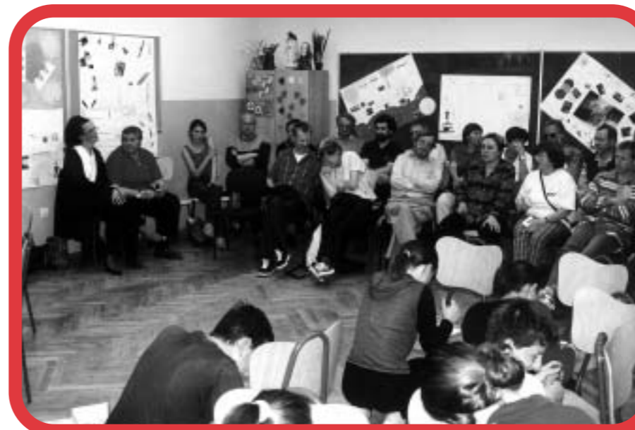
Detalj s radionice u školi u Kneževim Vinogradima.

Kreativne se radionice održavaju u tridesetak škola, uglavnom na području Osječko-baranjske i Vukovarsko -srijemske županije. Većim dijelom organizirane su u osnovnim školama,