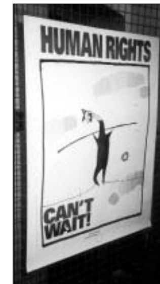
"Ljudska prava ne mogu čekati!" detalj s izložbe u prostorijama GISKO-a povodom Dana ljudskih prava, prosinac 2000.

Krajem 2000. i početkom 2001. godine intenzivirani su kontakti i suradnja s organizacijama koje se rade na povratku iz SRJ. Održano je nekoliko radnih sastanaka u SRJ, a delegacija predstavnika izbjeglica iz Beograda posjetila je Osijek. Kako prema planu o povratku 31. prosinca 2001. ističe rok za prijavu povratka, namjera je pomoći kampanju registracije za povratak, a ako se pokaže potrebnim i kampanju za produženjem roka. Produženje roka je posebno važno za osobe koje ne mogu ostvariti državljanstvo, što je preduvjet za sve ostale radnje.