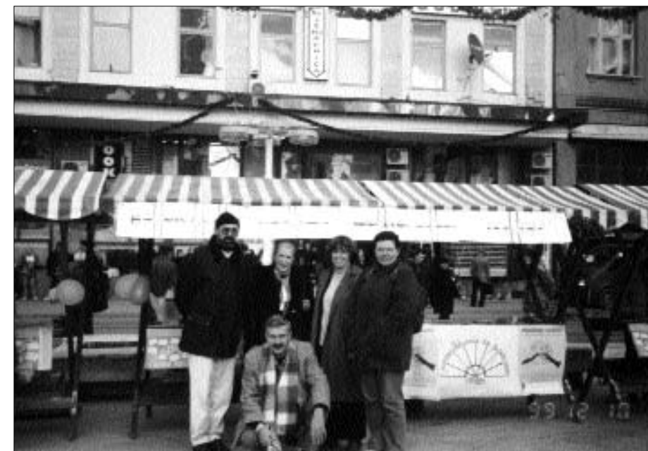
Jedna od dječjih ekipa na štandu povodom "Dana ljudskih prava", 1999.

Iako bez nenamjenskih izvora financiranja, glavni su ciljevi projekta ostvareni, ponajviše zaslugom grupe entuzijasta koji su na njemu surađivali.