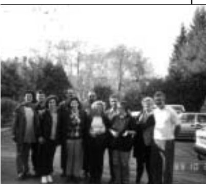
Radionica s ciljem oporavka i razvoja tima Programa promocije i zaštite ljudskih prava je bila vrlo uspješna.