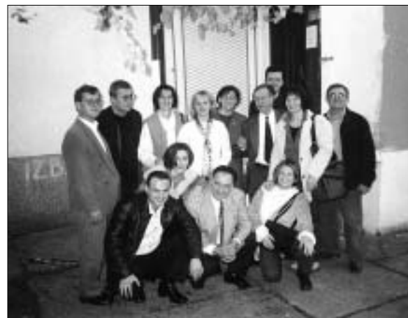
"Zdravo da ste".

Projekt Izgradnja demokratskog društva temeljenog na kulturi nenasilja u svojem je planu imao uspostavu subregionalne suradnje i primjenu projekta slušanja u modelu poslijeratne izgradnje mira. Najveće su uspjehe postigli u otvaranju suradnje s grupom Lice mira iz Slavenskog Broda pri čemu je većina aktivnosti provedena u Republici Srpskoj unutar BiH, kroz grupu "Mir za sve" (Gornji Vakuf/Uskoplje), a kroz neke aktivnosti započela je suradnja s organizacijom "Zdravo da ste" (Banja Luka) te Pax Christi Banja Luka i Zenica.