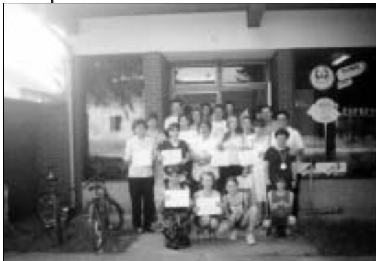
Otvoren je još jedan "Prozor" u svijet!

koristili i za procese izgradnje povjerenja između mještana susjedni sela (različitog etničkog sastava stanovništva).