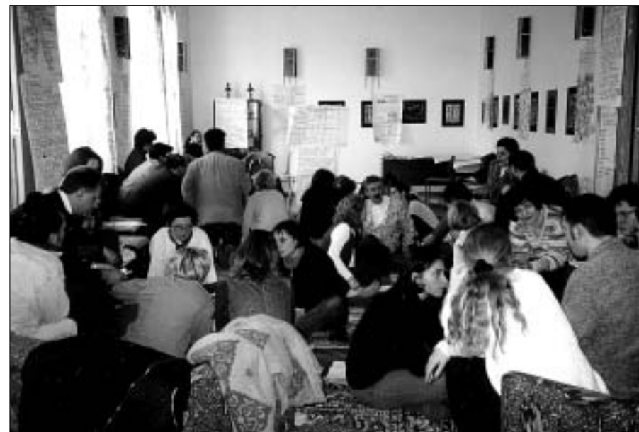
Vrijedno istražujemo zajedničko tlo za buduće planove.

Program savjetuje kako valja potaknuti na češće sastanke s ciljem bolje provedbe projekata i promišljanja razvoja. Istodobno bi bolja komunikacija i rasprave unutar programa pomogle bržem rješavanju problema, uklanjanju nesporazuma i sudjelovanja u procesu donošenja odluka na najširoj razini. I dalje se najčešće sastajao Program promocije i zaštite ljudskih prava što je pomoglo u njihovoj homogenizaciji. Program mirovnog odgoja i psihosocijalnog razvoja je, također, redovnije pristupao konzultacijama i razmjenama unutar programa a osnažen je i novim projektom pod nazivom Centar potpore za razvoj lokalnih NVO-a.