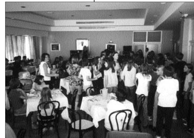
Nakon kupanja i igre na plaži slijedi zajednički ručak.

Radionice su za cilj imale edukaciju učenika u vještinama nenasilne komunikacije, medijacije i iskazivanju vlastitog stava i mišljenja. Razvijanje ovih vještina uključilo je i kreativan rad na emocijama i sustavu vrijednosti. Tu su važno mjesto zauzimali pojmovi samopoštovanja, poštovanja, uvažavanja, solidarnosti i odgovornosti. Učili su kroz igru slušati i razumjeti druge.