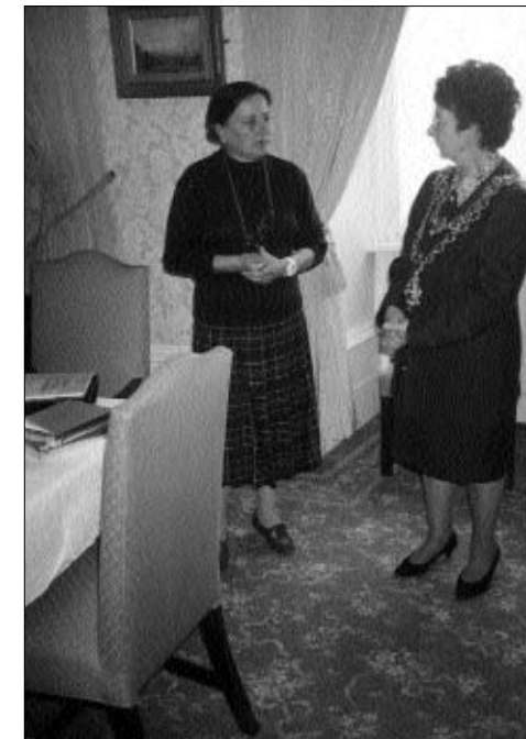
Voditeljica projekta zajednička klupa na primanju kod gradonačelnice Stratford-Upon-Avon; Razmjena iskustava uz srdačnu dobrodošlicu.

Primjeri samo-organiziranja građana koji su viđeni u Engleskoj i Nizozemskoj bili su dobar poticaj za promjenu stava: "Mi smo suviše mali, ne možemo ništa učiniti.", te poticaj da se građani počnu sami organizirati.