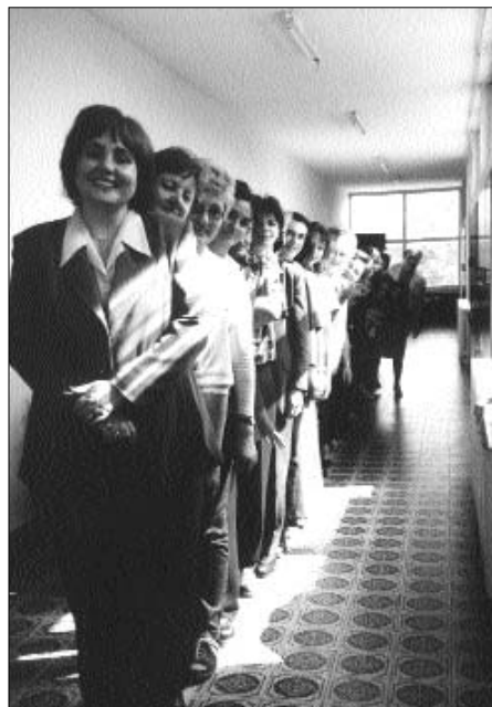
Članice projekta "Kreativne radionice" s gošćama iz Vukovara.

Smatramo važnim napomenuti kako su se i uvjeti u širem društvenom okružju nakon siječanskih izbora promijenili. Naime, nova vlast pokazuje znatno više sluha za mirotni rad te je suradnja sa školama poboljšana. Unatoč toga, za sada je nerealno očekivati znatniju financijsku pomoć, koja bi trebala biti sastavni dio potpore Vlade u programima ovakve vrste. Demokracija i mirotnost zahtijevaju i potiču stalno potrebu razvijanja svojih kapaciteta za razumijevanje i djelovanje, stoga će potreba za navedenim aktivnostima za mlade i učitelje postojati još dugu niz godina.