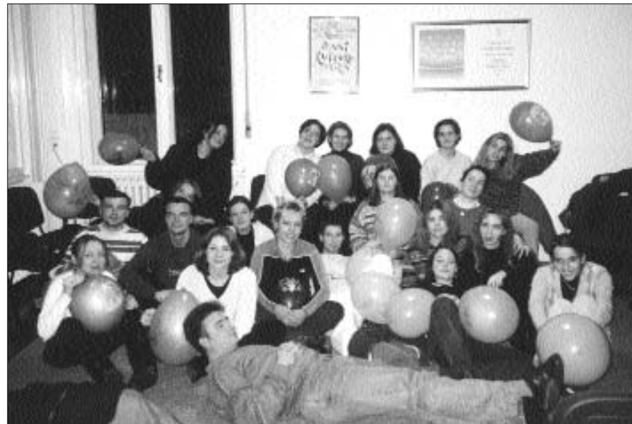
Studentska grupa "Kreativnih radionica".

Smatramo osobito važnim istaknuti rad u Društvu invalida cerebralne i dječje paralize gdje se redovito održavaju radionice te u Centru za odgoj i osnovno obrazovanje "Ivan Štark" (školi s posebnim uvjetima obrazovanja za osobe s posebnim potrebama - mentalnom retardacijom) gdje tri učiteljice-voditeljice redovito održavaju radionice s mladima s posebnim potrebama i njihovim roditeljima (više o radu u Društvu invalida cerebralne i dječje paralize u izvještaju projekta "Koraci").