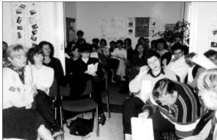
Skupština 99: Na okupu članstvo prošireno mirovnim timovima - hoćemo li prepoznati zajedničko tlo...

U razdoblju od 1999. do 2001. ukupan broj korisnika programa i aktivnosti Centra za mir iznosio je 46.208, od čega 11.339 korisnika pravne pomoći, 33 prigovarača savjesti, 2370 učenika osnovnih i srednjih škola, 320 djece bilo je na ljetovanju, 80 umirovljenika, 87 vjernica, 1315 mladih, 930 žena, 400 sudionika Dana kulture mira, 10.876 povratnika i stanovnika Baranje i istočne Slavonije, oko 18.000 građana - birača. Među korisnicima je i veći broj lokalnih udruga. Putem medija i tiskanih materijala dosegnuto je oko 200.000 ljudi, posebno tijekom predizborne kampanje.