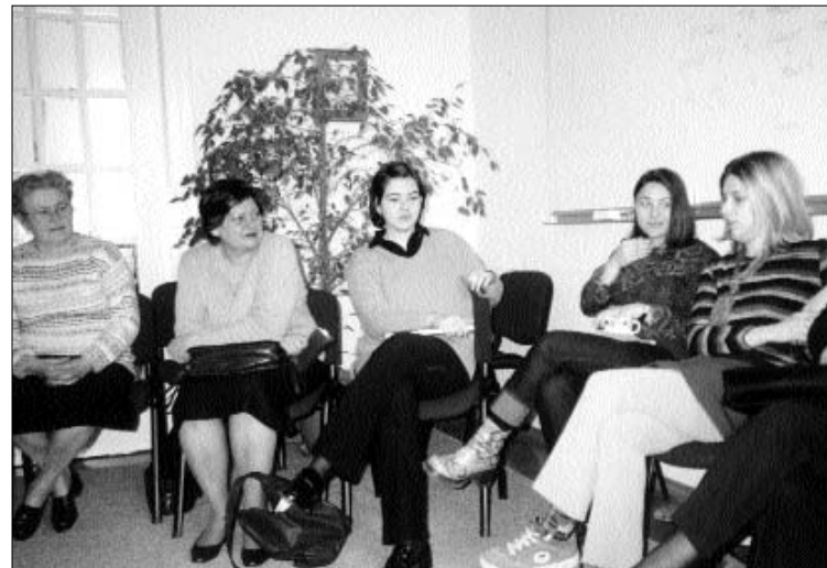
Članice ženske grupe "Femina" okupljene oko radionice o ženskim pravima.

Grupe podrške organizirane su u suradnji s Mirovnim timovima u mjestima gdje timovi djeluju: Tenja, Okučani, Beli Manastir, Dalj i Vukovar.