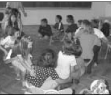
"Korak po korak..." radionica s djecom, Osijek 2001.

Prema zaprimljenim izvještajima tijekom 2000. godine ukupno je održano 1089 radionica (odn. 2421 sati) s djecom, roditeljima, studentima i učiteljima. Ukupno se radilo sa 50 stalnih skupina djece, dvije stalne skupine učitelja te jednom grupom studenata. Povremeno su radom u radionicama bile obuhvaćene skupine roditelja te drugih učitelja.