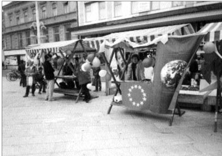
Štandovi za Dan Europe na glavnom Osječkom trgu plijenili su poglede svojom raznolikošću.