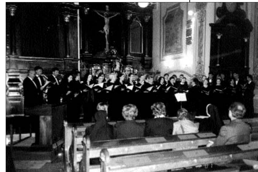
Nastup interreligijskog zbora PONTANIMA u Osijeku 2001.

Svake je godine oko 400 sudionika aktivno sudjelovalo na Danima kulture mira, a više tisuća osoba bilo je prisutno na raznim događanjima. Sve su aktivnosti medijski popraćene priložima u lokalnim i nacionalnim medijima. U siječnju 2000. dovršen je kratki dokumentarni film Dani kulture mira '99. na hrvatskom i engleskom jeziku. Uspostavljena je suradnja s lokalnim vlastima (Okučani, Beli Manastir, Dalj), pri čemu posebnom moramo istaknuti nastavak višegodišnje dobre suradnje s Poglavarstvom grada Osijeka.