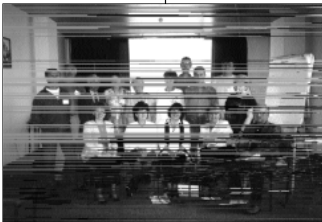
Seminar sa grupom župljana iz Batine - Međuvjersnička suradnja u izgradnji mira.

U okviru "Dana kulture mira" 1999. godine projekt je svoj doprinos dao koncertom duhovne glazbe i poezije pod nazivom "On je naš mir". Održana je ekumenska molitva za mir, te dramska predstava "Pokidani okovi".