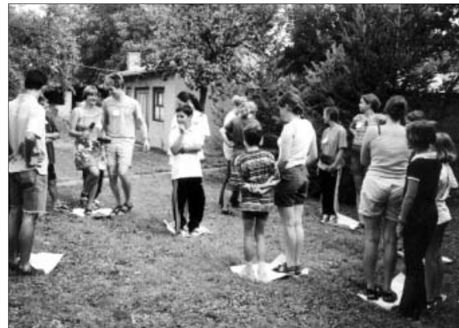
Pax Christy ruta 2000.

U suradnji s udrugom "Ravangrad" iz Sombora organizirano je zajedničko ljetovanje za 200 djece iz Hrvatske i SR Jugoslavije. Zajedno s Pax Christi International Youth Forumom organizirana je međunarodna ruta u Hrvatskoj (Split i Osijek) za dvadesetak mladih iz cijelog svijeta.