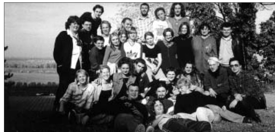
Budući mirovnjaci na okupu - sigurno vođeni veterankom.

Kao i cijeli proces evaluacije i planiranja, tako je i pisanje projektnog prijedloga provedeno participatorno, uz sudjelovanje članova MT-ova. Projekt je postao "NAŠ". To se je najbolje vidjelo u fazi kada je, radi nedostatka financija, projekt mjesecima provoden na volonterskoj osnovi. U svim su se lokacijama, osim Dalja, aktivnosti održavale na volonterskoj osnovi gotovo ne smanjujući intenzitet rada. Također, postalo je vidljivo koliko se mještana volontera bilo spremno uključiti, tj. u koliko mjesta je održivost procesa već osigurana.