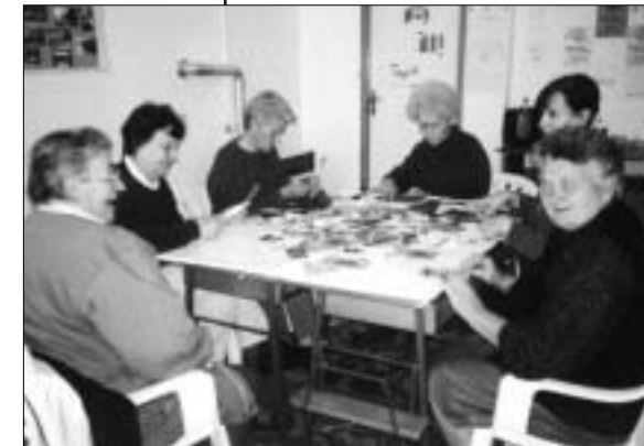
Članice humanitarne grupe iz Tenje.

Članice projekta su sudjelovale u planiranju i oblikovanju sub-regionalnog projekta suradnje crkava iz Hrvatske, BiH, Jugoslavije i Albanije na obrazovanju za nenasilje.