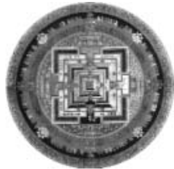
Centar za mir sudjelovao je u radu odbora za posjet Njegove Svetosti Dalaj-Lame Zagrebu 22. i 23. listopada 2001. godine.