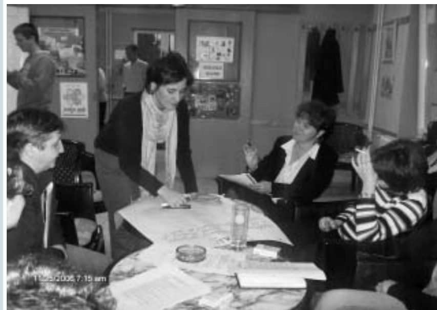
Studijska posjeta Tuzli organizatora zajednica iz Hrvatske - Dalj, Beli Manastir i Tenja

Fondacija tuzlanske zajednice provodi programe i daje financijske potpore