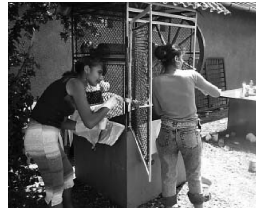
Mladi iz Dalja, Vukovara i Belog Manastira pomažu urediti prostor udruge Luna

Mlade usmjeravam da završe makar zamat i da razmisle, jer su zreliji s 18 nego s 14 godina. Želio bih da se ne žene prije 18. godine, posebice djevojčice.