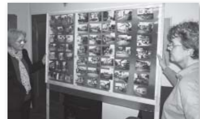
Prikaz aktivnosti udruge Duga na obilježavanju Dana općine Okučani

nje od dva mjeseca volonterski tim je uspio realizirati projekt kojim su Okučani dobili mogućnosti smještaja za tridesetdvije osobe, a time i uvjete za odražavanje većih manifestacija i seminara.