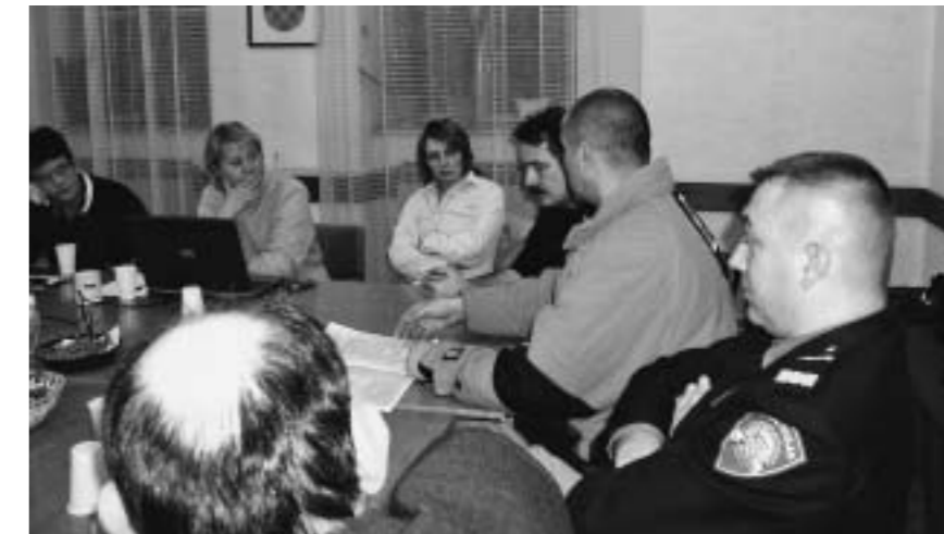
Predstavnici lokalne samouprave, policije, vijeća manjina, škole i udruga u Volonterskom centru Tenja dogovaraju suradnju

renja, poboljšani su suradnički odnosi građana, udruga i lokalne uprave iz čega je proizašao niz zajedničkih aktivnosti od značaja za zajednicu. ■