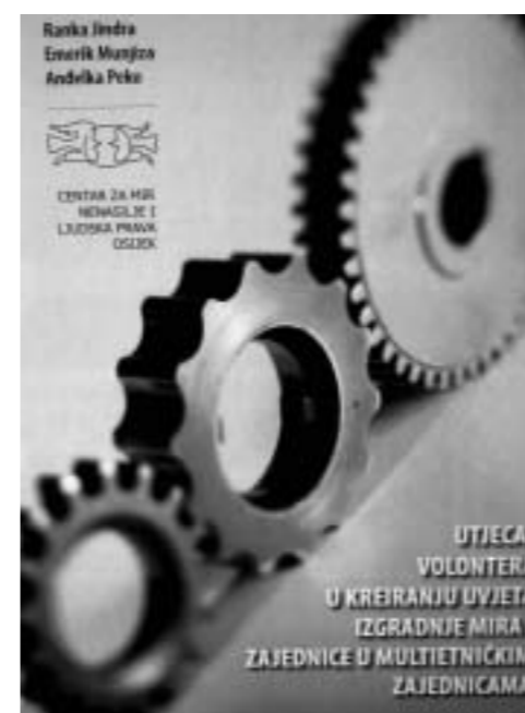
Utjecaj volontera u kreiranju uvjeta izgradnje mira i zajednice u multietničkim zajednicama

Vidljive su pozitivne promjene na većini analiziranih područja i pojedinačnih varijabli te bi mogli prihvatiti tezu da se stvaraju povoljni uvjeti zajednice za samoodrživi razvoj u uvjetima multietničkih zajednica.