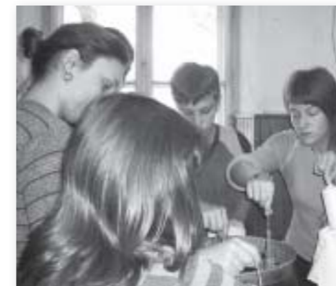
Kreativne radionice se održavaju subotama od 10 do 13 sati u prostoru Mjesnog odbora Tenja .