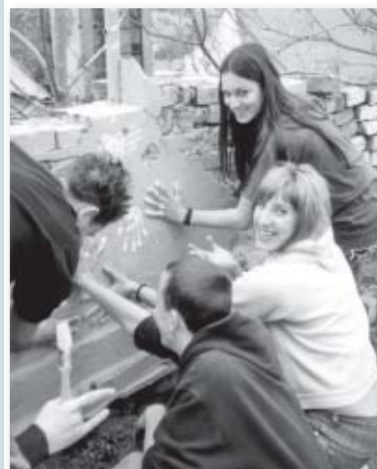
Klub mladih u Vukovaru: sami uredili svoj prostor i družili se

Niz problema s kojima smo se susreli u radu s mladima jeste njihova pasivnost, neznanje kako mogu djelovati i učiniti promjene u svojim životima, nemogućnost ili poteškoće pri zapošljavanju. Imamo mlade koji se ne izražavaju mnogo, koji govore onako kako su čuli od starijih i „iskusnijih“. Mali broj mladih osoba se za-