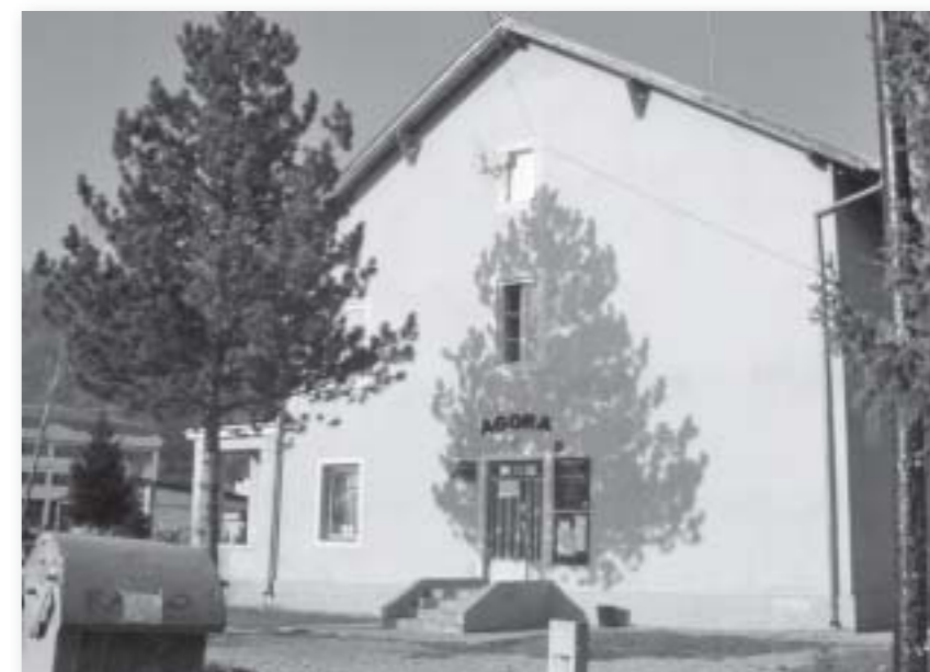
Obnovljena zgrada Agora centra u Simin Hanu

Lijep primjer organiziranja zajednice je razvoj Agora centra u Simin Hanu. Prije 4 godine centar je bio zapušten i tek dijelom iskorišten javni objekt u kojem se nalazio ured Mjesne zajednice Simin Han. Renoviran je u suradnji s općinskim vlastima iz sredstava stranih donatora. Fondacija je preuzela brigu o održavanju prostora. Danas Agora centar predstavlja okosnicu društvenog života u Simin Hanu. Na katu se nalaze uredi Mjesne zajednice i Fondacije, a prizemlje stoji na raspolaganju