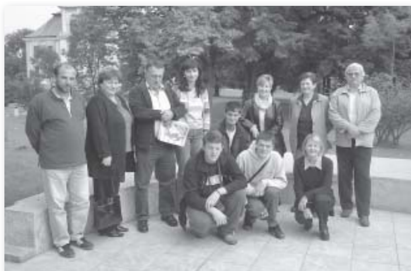
Nekoliko dana zajedno u Našicama, mještani i predstavnici lokalne uprave planirali su poželjnu budućnost Dalja

Usredotočenost na budućnost je dobra za razvoj zajednice