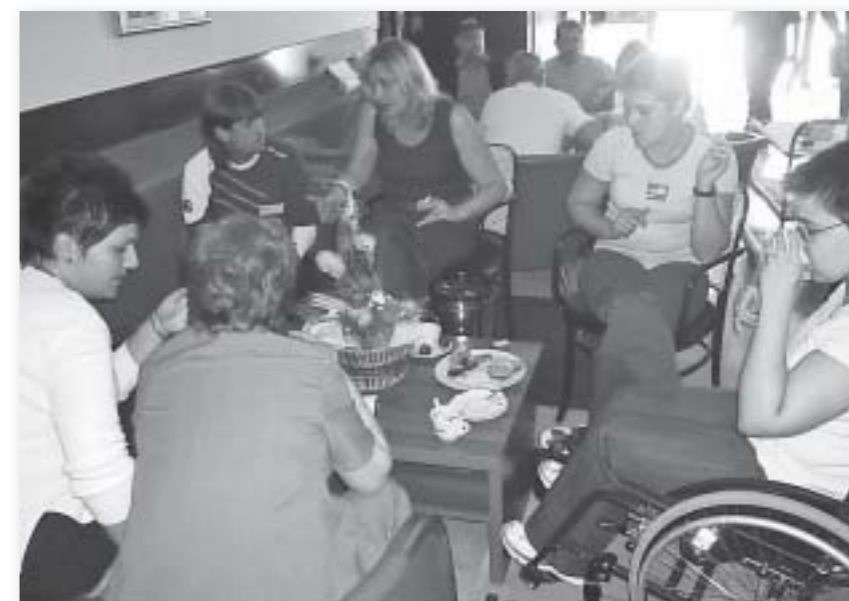
Pjesnici za mir na radionici: i na stankama se razgovara o temi