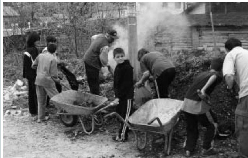
I stari i mladi u čišćenju okoliša - da u Tenji bude ljepše

Centar za mir nam je pomogao da smo godinu dana i više na zajedničke sastanke i edukacije okupljali predstavnike lokalne samouprave i institucija i predstavnike udruga te mještane. Tamo se je moglo i razgovarati o problemima i o suradnji, a mogao se i bolje upoznati rad udruga. U Tenji danas ima oko dvadeset (20). Mislim da je osnivanje Volonterskog centra potaklo i druge udruge na osnivanje i dalo im sigurnost da se mogu javiti sa svojim problemima ili inicijativama. ●●●