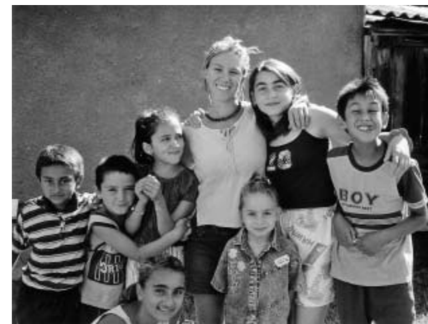
Udruga romskog prijateljstva Luna: učenje kroz povezivanje, radionice engleskog jezika sa volonterkom iz Norveške

Do prije pet godina bilo je nepojmljivo da mladi Srbi i Hrvati sjednu zajedno u kafić. Potrebno je što više govoriti o svojim predrasudama, stavovima i vide-njima. Svi mi imamo predrasude, ali ako se o tome bude govorilo, bit će manje sukoba. Onda je i manja vjerojatnost da će biti rata. Zato i učimo djecu nenasilnoj komunikaciji, da kažu svoje potrebe, želje i viđenja na način da nikoga ne uvrijede. Nadamo se da će i oni isto tako u svojim obiteljima promovirati toleranciju i nenasilje.